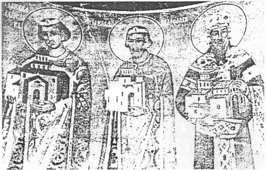
Сл. 3. Део поворке српских средњеveковних владара. Фреска из јужне конхе цркве Светог Кнеза Лазара у Прибоју на Лиму