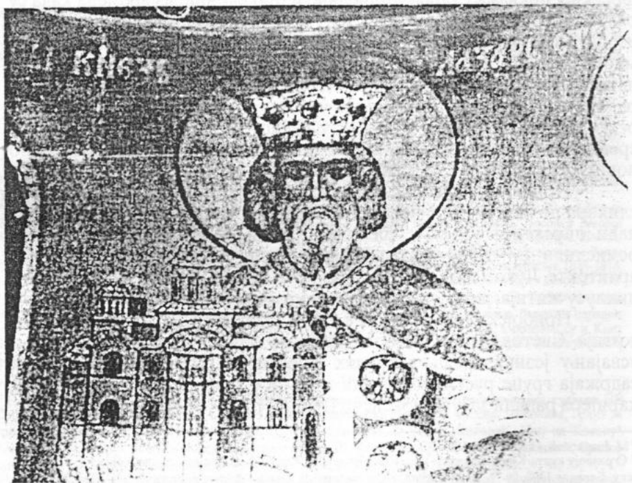
Сл. 4. Свети Кнез Лазар. Фреска у северној конхи прибојског храма