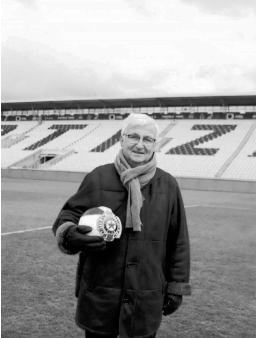
До краја веран Партизану