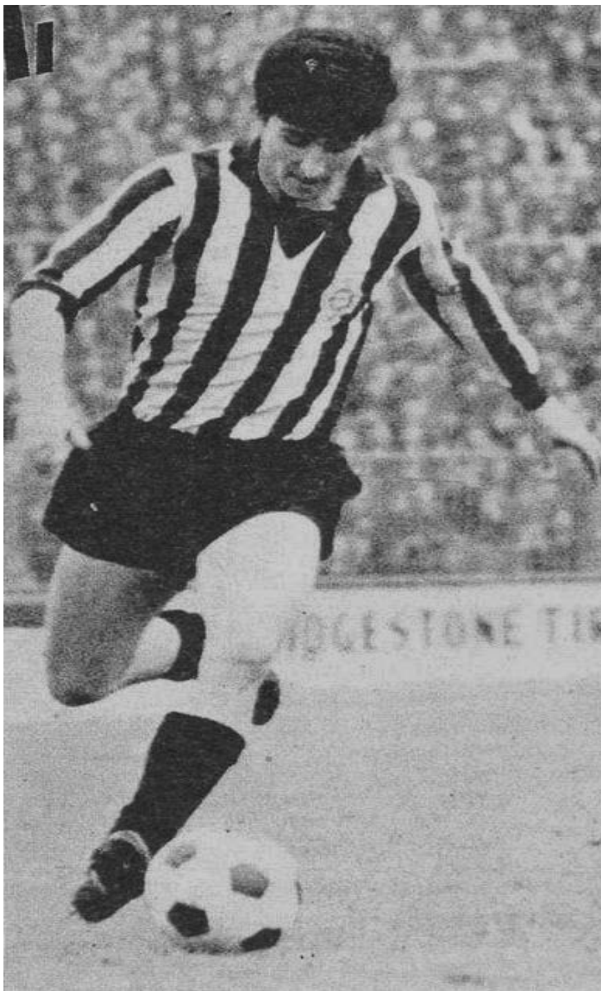
Детаљ са утакмице