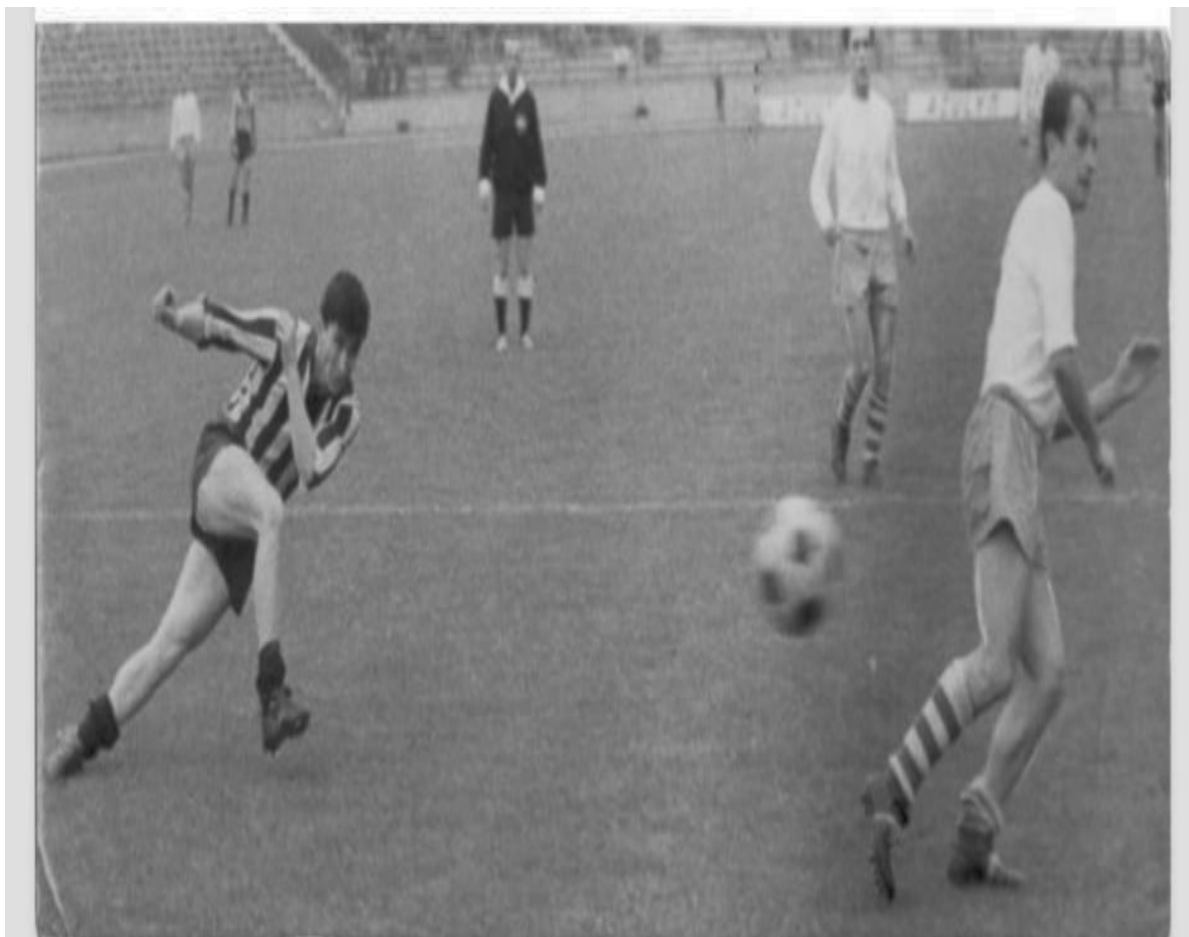
Детаљ са утакмице