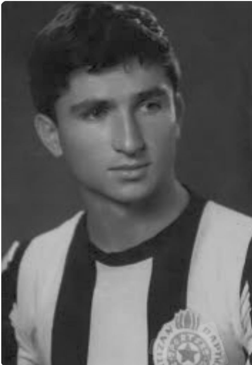
Потписан уговор са Партизаном