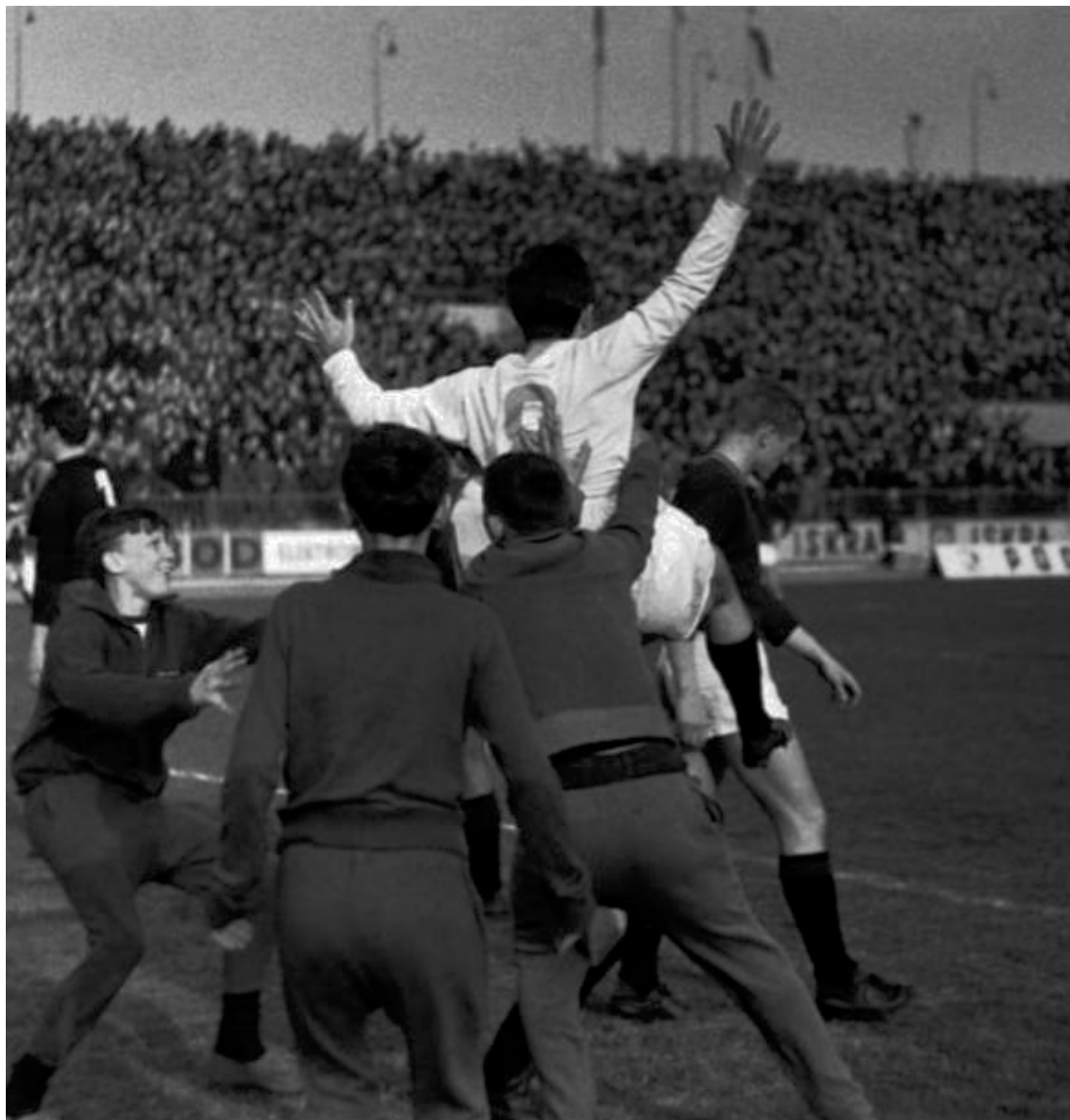
Радост после сваког гола