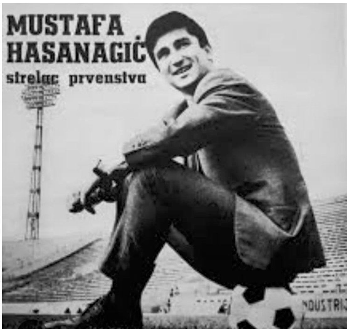
Најбољи стрелац првенства